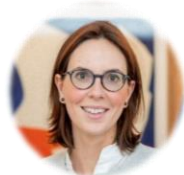
Amélie de Montchalin Secrétaire d'Etat auprès du Ministre de l'Europe et des Affaires étrangères en charge des Affaires européennes, République française