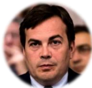
Vincenzo Amendola Ministre des Affaires européennes, République italienne